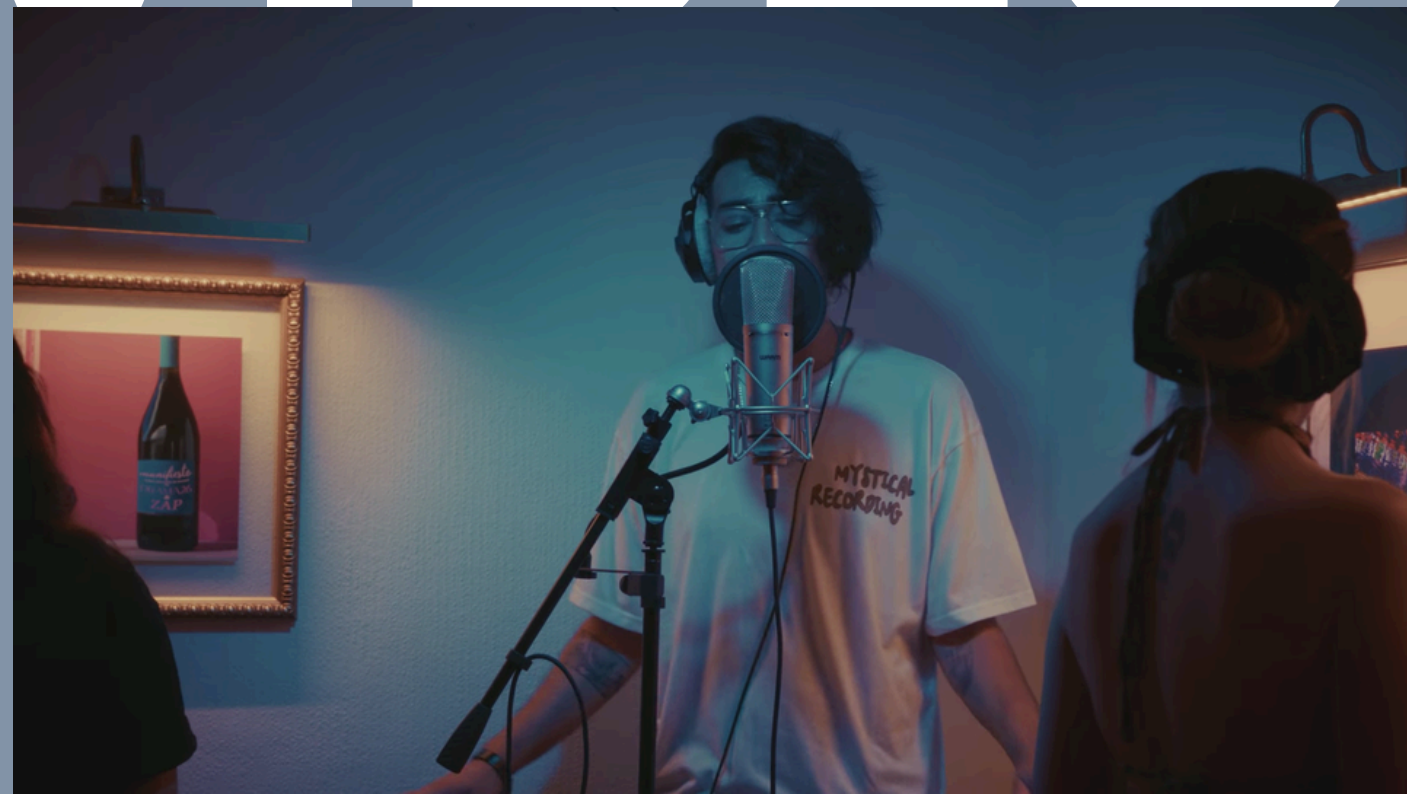
AGOSTO 2025 “MUSEO NACIONAL DEL DRAMA”