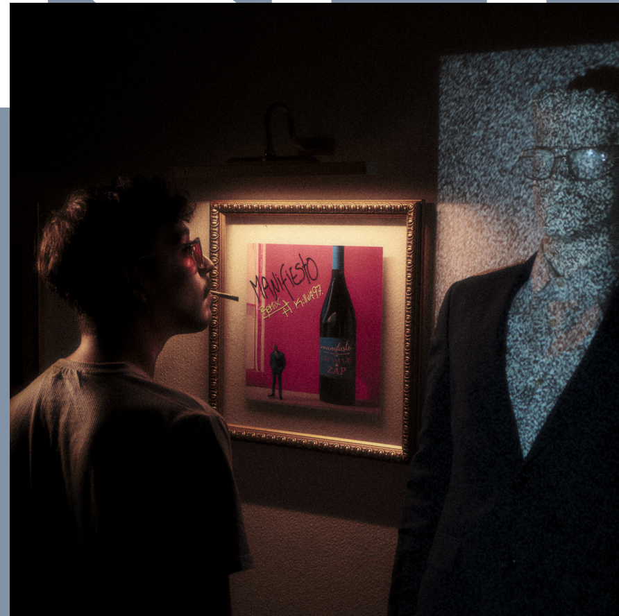
FEBRERO 2026 “MANIFIESTO PT.2” SINGLE