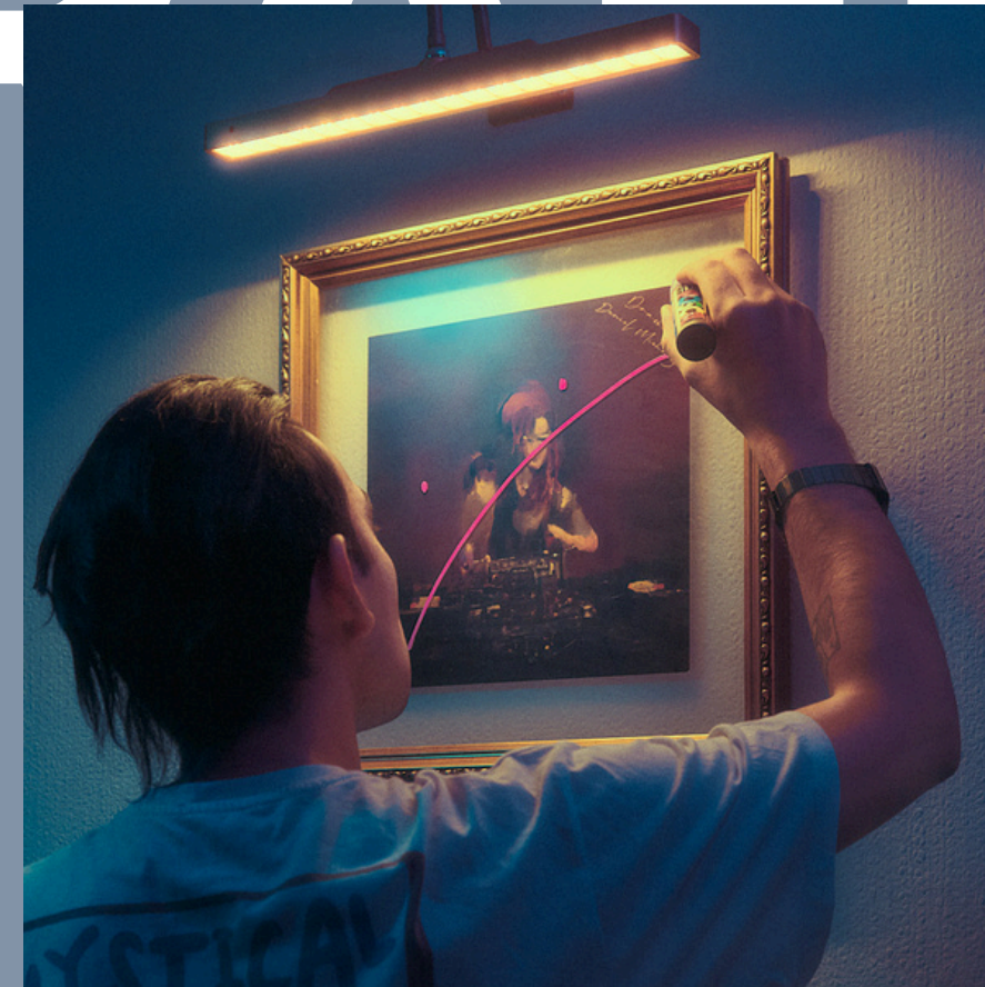
AGOSTO 2025 “MUSEO NACIONAL DEL DRAMA” LP